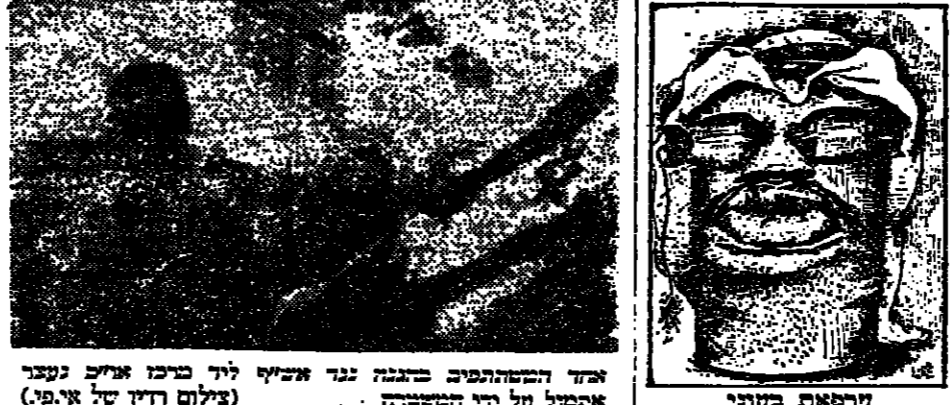
ערפאת בקריית ירקן